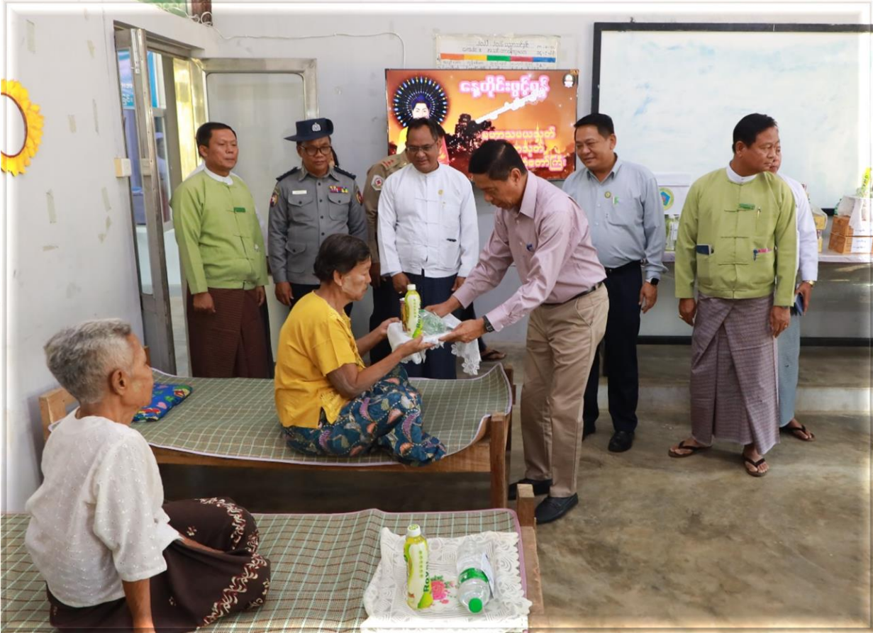
၂၀၂၆ ခုနှစ်၊ ဧပြီလ ၂ ရက်

လူမှုဝန်ထမ်း၊ ကယ်ဆယ်ရေးနှင့် ပြန်လည်နေရာ ချထားရေးဝန်ကြီးဌာနအနေဖြင့် မိမိတို့ နေအိမ်များတွင် နေထိုင်ရန် ခက်ခဲပြီး အပူဒဏ်တိမ်းရှောင်ရန် လိုအပ်သူ များအတွက် အပူရှောင် စခန်းများအား မကွေးမြို့နယ်၊ ရေနံချောင်းမြို့နယ်၊ ချောက်မြို့နယ်နှင့် နတ်မောက် မြို့နယ်များတွင် ၂၀၂၆ ခုနှစ်၊ မတ်လ ၁၆ ရက်မှ စတင် ဖွင့်လှစ်ပေးထားပြီး အပူရှောင်လာရောက်သူများအား သဘာဝ ဘေးအန္တရာယ်နှင့်စပ်လျဉ်း၍ အသိပညာပေး ဟောပြောခြင်း၊ လက်ကမ်းစာစောင်များ ဖြန့်ဝေခြင်း၊ အပူဒဏ်ကာကွယ်နိုင်ရေး ဆောင်ရန်/ ရှောင်ရန်များအား ကျယ်ကျယ်ပြန့်ပြန့် အသိပညာပေးခြင်းများ ဆောင်ရွက် ပေးလျက်ရှိပါသည်။