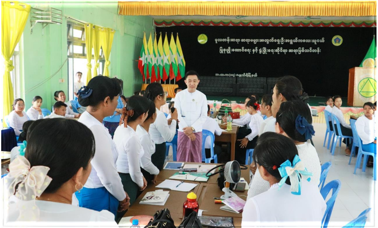
၂၀၂၆ ခုနှစ်၊ ဧပြီလ ၂၇ ရက်

အမြစ် ဖွံ့ဖြိုးတိုးတက်ရေးကို တိုက်ရိုက်အကျိုး ပြုမည် ဖြစ်ပါကြောင်း ပြောကြားခဲ့ပါသည်။