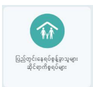
ပြည်တွင်းနေရပ်စွန့်ခွာသူများ ဆိုင်ရာကိစ္စရပ်များ