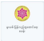
မူးယစ် ပြန်လည်ထူထောင်ရေး ဝန်ခံ