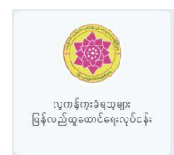
လူကုန်ကူးခံရသူများ ပြန်လည်ထူထောင်ရေးလုပ်ငန်း