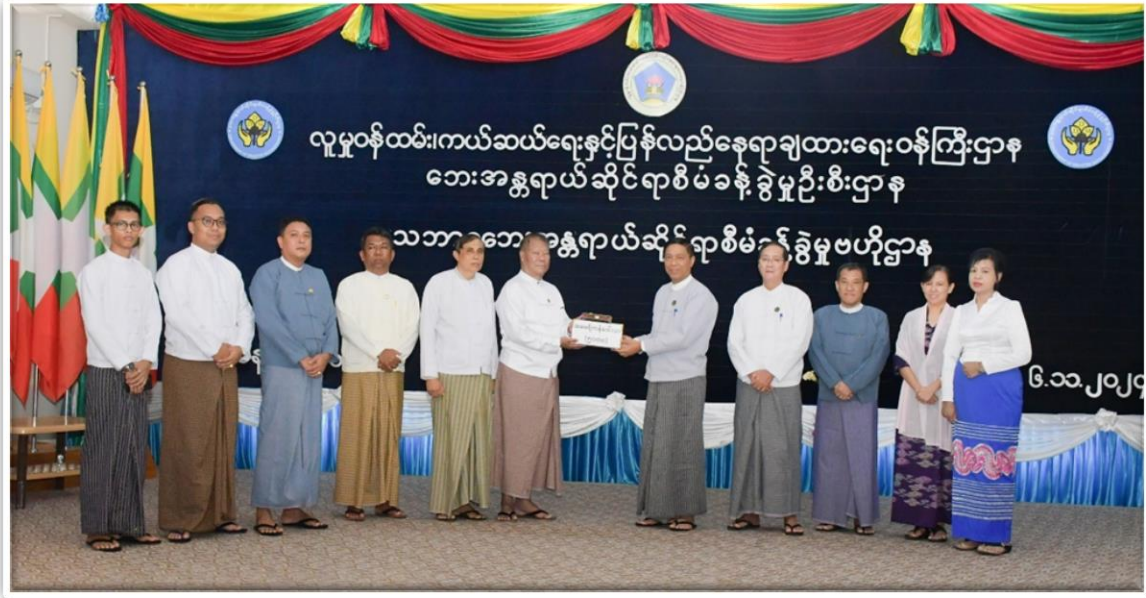
၂၀၂၄ ခုနှစ်၊ နိုဝင်ဘာလ ၆ ရက်နေ့

ခွဲရာ ပြည်ထောင်စုဝန်ကြီး၊ ဒေါက်တာစိုးဝင်းကလက်ခံရ ယူနိုက်တက်ပြုမှတ်တမ်းလွှာပြန်လည်ပေးအပ်ခဲ့ပါသည်။