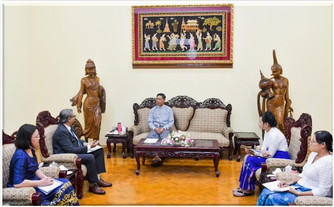
၂၀၂၄ ခုနှစ်၊ နိုဝင်ဘာလ ၁၉ ရက်

ပြည်ထောင်စုဝန်ကြီး ဒေါက်တာစိုးဝင်း ကုလသမဂ္ဂလူသားချင်းစာနာမှုဆိုင်ရာ ညှိနှိုင်းရေးရုံး (UNOCHA) ၏ အကြီးအကဲဖြစ်သူ Mr.Sajjad Mohammad Sajid အား လက်ခံတွေ့ဆုံ