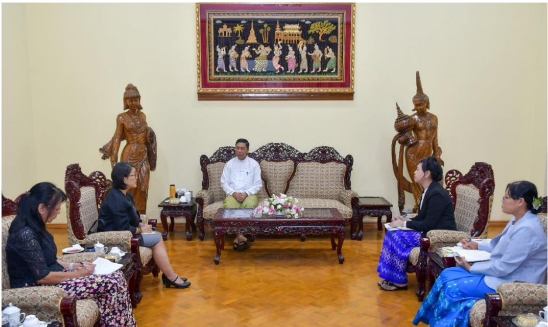
၂၀၂၄ ခုနှစ်၊ နိုဝင်ဘာလ ၂၈ ရက်