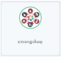
ဘေးလျှော့ပါးရေး