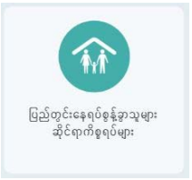
ပြည်တွင်းနေရပ်ရွှေ့ရွာသူများ ဆိုင်ရာကိစ္စရပ်များ