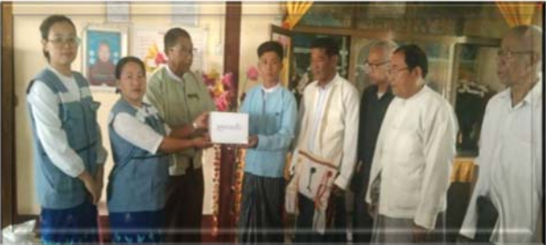
(၂၈-၃-၂၀၂၃) ရက်နေ့တွင် လားရှိုးခရိုင်ဦးစီးမှူး ရုံးမှ တာဝန်ရှိသူများသည် လားရှိုး မြို့နယ်၊ ရပ်ကွက် (၁၂)၊

နယ်မြေ(၂၀)၊ ကချင်ကုန်းဒေသတွင် ဖြစ်ပေါ်နေသော သောက်သုံးရေအခက်အခဲအတွက် သက်ဆိုင်ရာအိမ်မှူး၊ ဆယ်အိမ်မှူးနှင့် ရပ်မိရပ်ဖ များထံသို့ (၄") စက်ရေတွင်း ၀၆(၄၀၀)၊ ဂါလန် (၁၅၀၀) ဆုံအုတ်ရေကန်နှင့် ရေတင် စက်ရုံတည်ဆောက်နိုင်ရေးအတွက် ငွေကျပ်(၉,၅၀၀,၀၀၀) (ကိုးဆယ့်ငါးသိန်းကျပ်တိတိ) အား ထောက်ပံ့ဆောင်ရွက် ခဲ့ပါသည်။