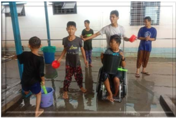
ရန်ကုန်တိုင်းဒေသကြီး အစိုးရအဖွဲ့မှ ကြီးမှူး ကျင်းပသော ရန်ကုန်မြို့ ပြည်သူ့ရင်ပြင် ရှိ Royal Apex

ရေသဘင်ပွဲ၏ ဌာနဆိုင်ရာရေပက်မဏ္ဍပ် (၁၀) ခုအနက် နွေဦးကဗျာသင်္ကြန်ရေကစားမဏ္ဍပ်တွင် ကျိုက်ဝိုင်းလူငယ် သင်တန်းကျောင်း၊ ရန်ကုန်အမျိုးသမီးကလေးများသင်တန်း ကျောင်းနှင့် အမျိုးသမီးများဖွံ့ဖြိုးတိုးတက်ရေးဌာနတို့မှ ကလေး (၄၀) ဦး၊ ဝန်ထမ်းမိသားစု(၁၀)ဦး စုစုပေါင်း (၅၀) ဦးသည် အခြားဌာနဆိုင်ရာ ဝန်ထမ်းများနှင့်အတူ နေ့စဉ် ရေပက်ကစားခြင်းကိုဆောင်ရွက်ခဲ့ကြပါသည်။ ထို့အပြင် ရန်ကုန်မြို့တော်ဝန် သင်္ကြန်ရေကစားမဏ္ဍပ်၌ ကျင်းပ သည့် (၁၂) ဦး ယိမ်းပြိုင်ပွဲသို့ ရန်ကုန်တိုင်းဒေသကြီး အတွင်းရှိ လူမှုဝန်ထမ်းဦးစီးဌာန၊ မူလတန်းကြိုကျောင်း (၄)ကျောင်းမှ ဝင်ရောက်ယှဉ်ပြိုင်ခဲ့ကြပြီး အောက်ပါဆု များ အသီးသီးရရှိခဲ့ကြပါသည်-