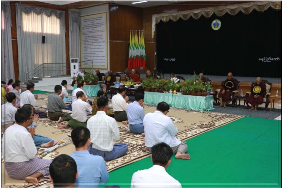
၂၀၂၃ ခုနှစ်၊ ဧပြီလ ၁၇ ရက်နေ့