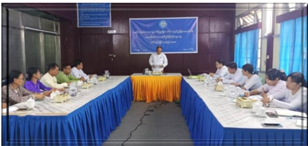
ဧရာဝတီတိုင်းဒေသကြီး ရှေးဦးအရွယ်ကလေးသူငယ်