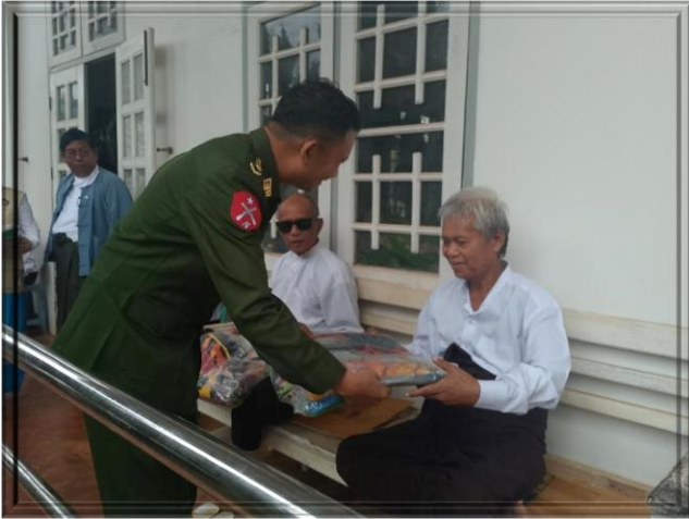
ရှမ်းပြည်နယ်၊တောင်ကြီးခရိုင်၊ရပ်စောက်မြို့နယ်

သေဆုံးလူဦးရေ (၅) ဦးအတွက် သေဆုံးထောက်ပံ့ငွေကျပ် (၁,၅၀၀,၀၀၀/-) (၁-၈-၂၀၂၄) ရက်နေ့တွင် ရှမ်းပြည်နယ် ဦးစီးမှူးရုံးမှ သွားရောက်ထောက်ပံ့ခဲ့ပါသည်။