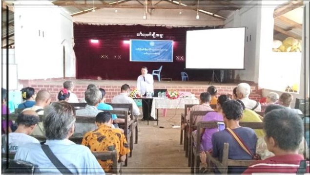
သက်ကြီးရွယ်အိုများဆိုင်ရာ ဥပဒေ/ နည်းဥပဒေ များ အသိပညာပေး အစီအစဉ်ကို (၉-၈-၂၀၂၄) ရက်တွင်